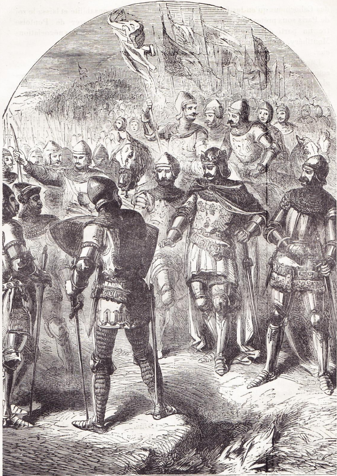
INVASION DES ANGLAIS (1415). — Les princes français firent demander au roi Henri V jour et lieu pour le combat.